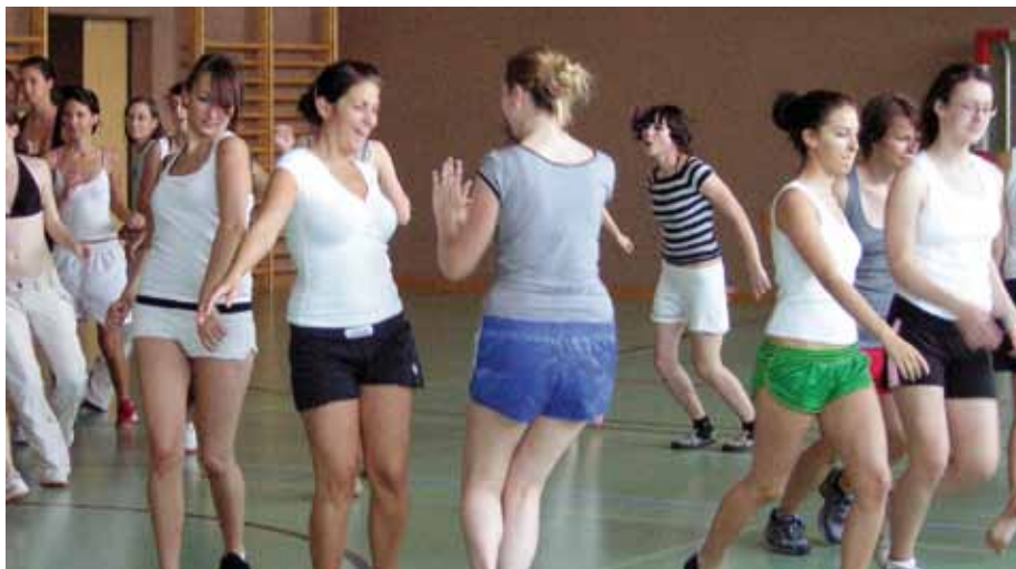
Arbeit mit Jugendlichen - die Übungsleiterausbildung zeigt wie es geht.