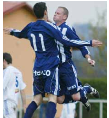
In Deutsch Kaltenbrunn hat allen Grund zu Luftsprüngen.