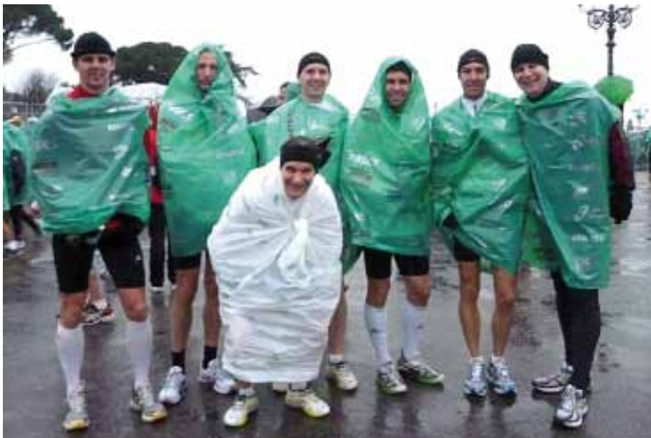
Die Crazy Krebsler Runners aus Oberpullendorf trotzten in Florenz beim Marathon Wind und Wetter.