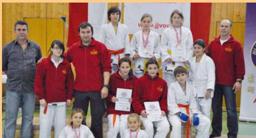
Der erfolgreiche Nachwuchs des SV Wallern bei den Meisterschaften in Wien.