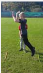
Übung 5: In Partnerarbeit: Ein Kind hält den Stab in der ge- wünschten Höhe des Springers, der dann diese Höhe zu überspringen versucht.