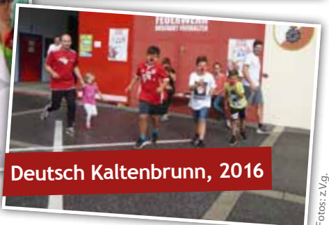
Deutsch Kaltenbrunn, 2016

„Bei unserer Diagnose lacht selbst der, der eigentlich ein Hypochonder wär.“