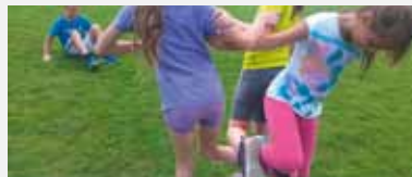
Übung 1: Die Kinder haken die Beine ineinander und versuchen sich zu dritt fortzubewegen.