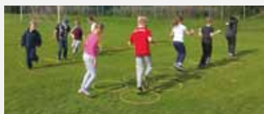
Übung 8: Beidbeiniges Hüpfen durch eine Reifenreihe (auf lockeres, federn- des Hüpfen achten)