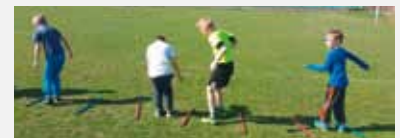
Übung 4: Seitlich über die Stäbe springen (Schwierigere Variante: in einer halben Drehung über den Stab springen und im Zwischenraum landen)