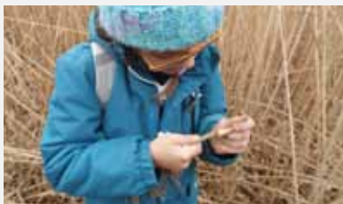
Übung 14: Kinder kosten Schilfwurzeln (Rhizome) und Schilftriebe, die einen hohen Gehalt an Stärke besitzen und sehr nährstoffreich sind! Eine japanische Delikatesse und sehr gesund! Wichtig bei Outdoor- und Survivalaktivitäten!