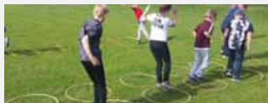
Übung 9: Beidbeiniges Pendelhüpfen in die Reifen