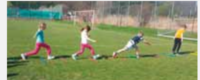
Übung 2: Riesenschritte über Stäbe