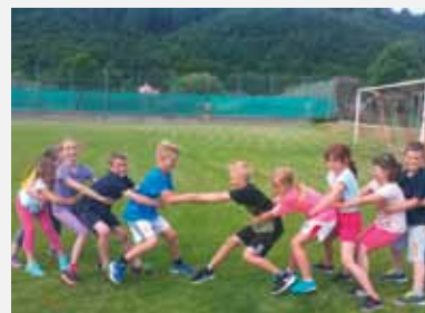
Übung 11: Seilziehen ohne Seil