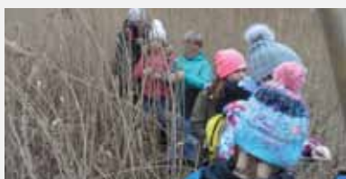
Übung 12: Die Kinder durchforsten eine Schilflandschaft, müssen beim Gehen die Beine höher anheben als sonst und auf Un- ebenheiten und „Stolpersteine“ achten!

Material: Schilf, Naturgegenstände, Gucker