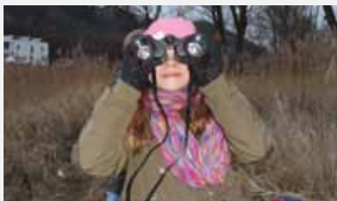
Übung 15: In aller Stille die Geheim- nisse des Schilfs erforschen und be- obachten!