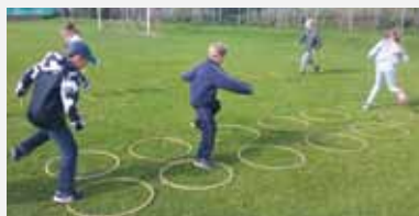
Übung 7: Reifen durchlaufen, dabei ist jedes Bein immer in einem Reifen