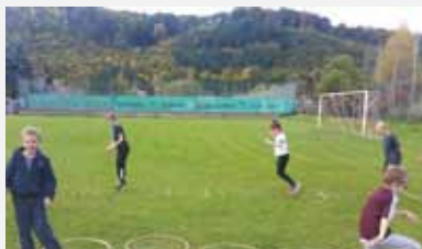
Übung 6: Eine Reifenreihe durchlaufen