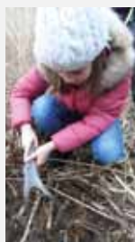
Übung 13: Mit Natur- material den Boden durchforsten! Die Enden des Hirschge- weihes eignen sich besonders gut den Boden zu bearbeiten, ohne dabei etwas zu zerstören!