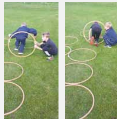
Übung 10: Partnerarbeit: Ein Kind stellt Reifen auf, Partner klettert durch, da- nach sofort die Rolle tauschen