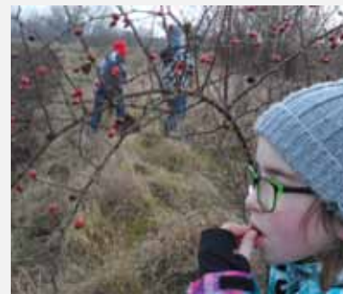
Übung 16: Die süßsaure Hagebutte, reich an Vitamin C, A, B1 und B2 wird am Nachhauseweg noch verzehrt!

Wertvolle Tipps zur Durchfüh- rung, Aufgaben- stellung und dem Umgang in der Gruppe finden sich auf