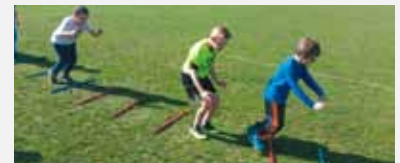
Übung 3: Beidbeiniges federndes Hüpfen über die Stäbe: erst in jeden Zwischenraum, danach darf jedes Kind so viele Stäbe auslassen, wie es sich zutraut